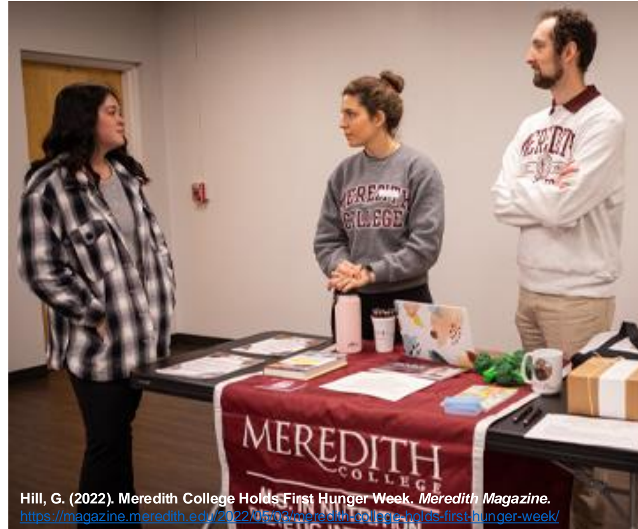
Hill, G. (2022). Meredith College Holds First Hunger Week. Meredith Magazine . https://magazine.meredith.edu/2022/05/03/meredith-college-holds-first-hunger-week/

La semaine thématique sur la faim et l'IA mise sur pied par le Meredith College. Documentée par Hagedorn-Hatfield & al., 2023.